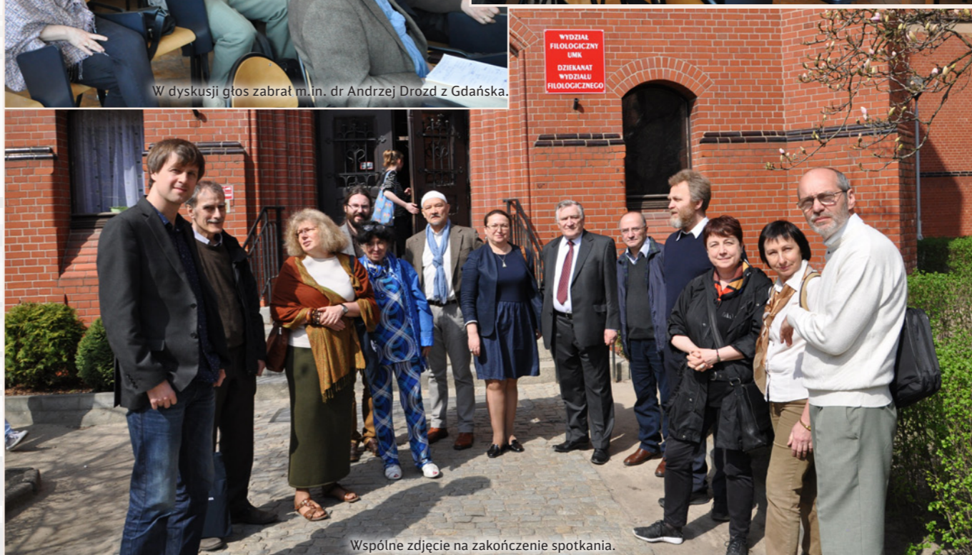
Wspólne zdjęcie na zakończenie spotkania.