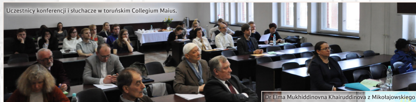
Uczestnicy konferencji i słuchacze w toruńskim Collegium Maius.